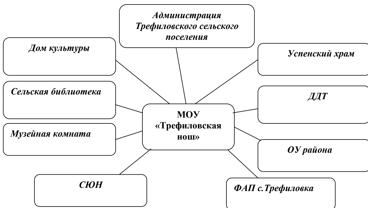
Схема взаимодействия с социумом

Среди родителей обучающихся и воспитанников дошкольных групп преобладают служащие, работники бюджетной и торговой сферы. По материальному положению семьи детей распределяются следующим образом: семьи с низким уровнем доходов (уровень доходов в семье на человека ниже прожиточного минимума) – 32%; со средним – 48%; с высоким – 20 %.